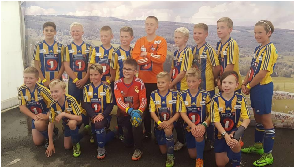
Sportslig hilsen v/ trenerteamet Faaberg G12, sesongen 2017